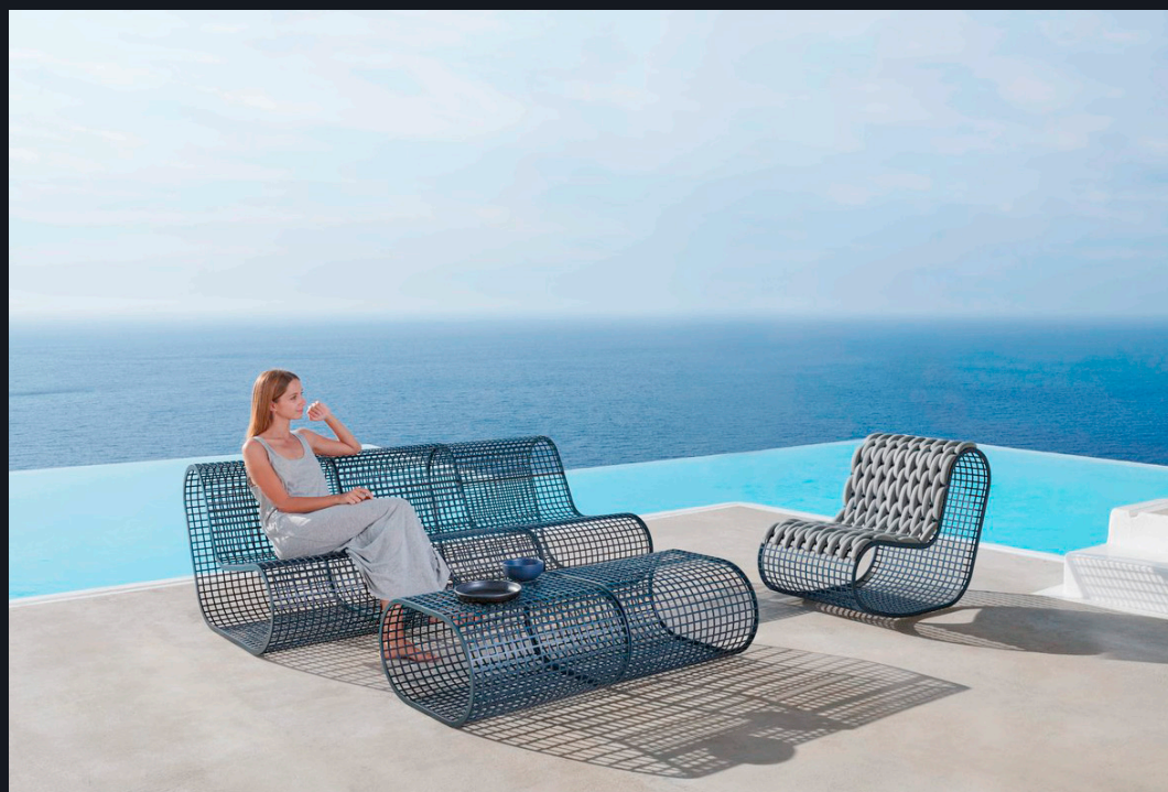
BUIT Collection. Mayice. Gandía Blasco