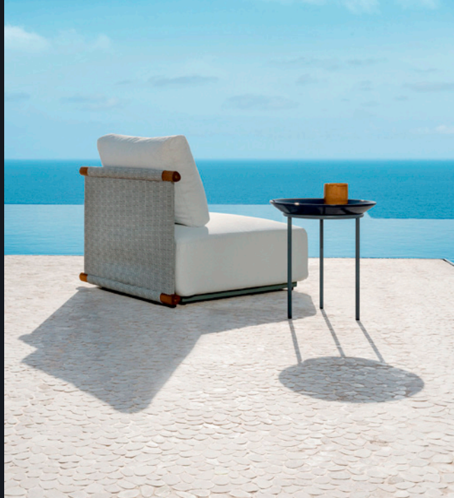
Hashi (Silla) y Brise (Mesa). Federica Biasi. Gervasoni